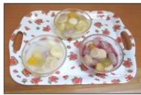
皆で作ったフルーツ白玉、3時のおやつにいただきました。

楽しいおやつ作りや風船ゲーム 一ヶ月の中で一週間をおやつ週間としてご利用者様達ご自身で選んだおやつを手作りいたします。女性はもちろん、男性