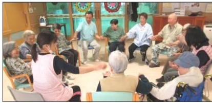
皆で輪になりお手玉送りゲーム

の方も楽しく参加していただき人気のレクリエーションです。また平行棒を使った歩行訓練や風船バレー・お手玉送りゲーム・カラオケなど楽しみながらの機能訓練や認知症予防にも力を入れております。