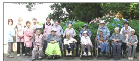
五感で感じる自然とのふれあい…

気分転換や季節の変化を感じていただくために、お花見・紅葉狩り・りんご園などへの外出にでかけております。車椅子の方などは、家族対応の外出もなかなか難しいと思われまので、大変喜んでいただいております。