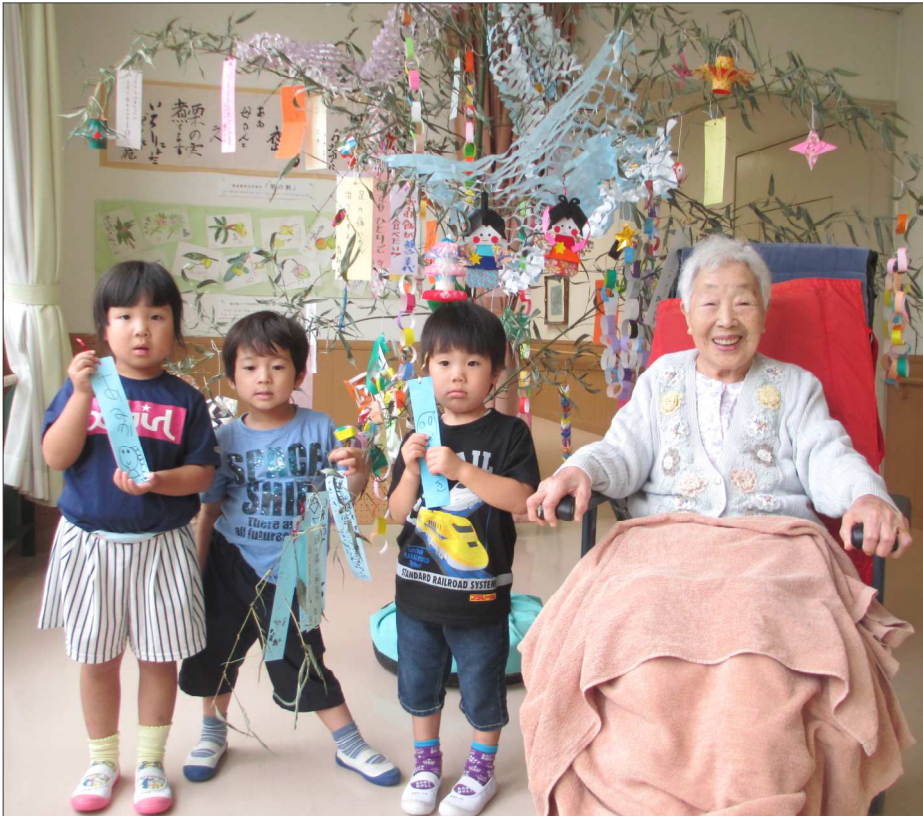
園児の皆様は将来の夢を、入所者の皆様はご家族様の安全や、ご自身の健康をお願いしました。

謹んで残暑お見舞い申し上げます 井戸水で冷やしたスイカを縁側で食べていた時の清涼感、神社の境内で蝉しぐれを聞いていた時の爽快感、そして海水浴が楽しめる夏休みが待っているという解放感など、幼い頃の懐かしい思い出もあり、夏は四季の