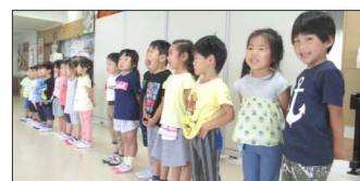
園児達の無邪気な笑顔に、元気をいただきました。