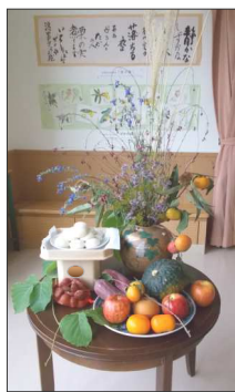
すすきに萩や女郎花、そして柿に割れ菘栗... お月見飾りに季節の移ろいを感じました。

変でしたが、一方果物にとつては旬の時期となり柿の色付き加減や菘栗の割れた様子が丁度見頃となっております。苑内に供えたお月見飾りをご覧になった入所者の皆様は、自宅でも毎年飾っていた事や色々な思い出話をされながら、活けられた秋の花や供えられた果物の色鮮やかさに「これぞ秋！」と感嘆され、長い時間鑑賞されておりました。 (十月四日)