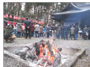
今では懐かしい焚火風景...