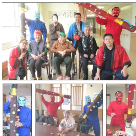
赤鬼・青鬼改心して、一緒に記念写真。

今年も厄除け祈願の『すずらん節分祭』を開催。職員扮する赤鬼・青鬼が、いかづち太鼓の音響とともに館内狭しと大暴れ。ご利用者の皆様は、大きな声で「鬼は外」「福は内」と豆を放って鬼退治。いよいよ明日には待ちに待った春の到来です。 (二月三日)