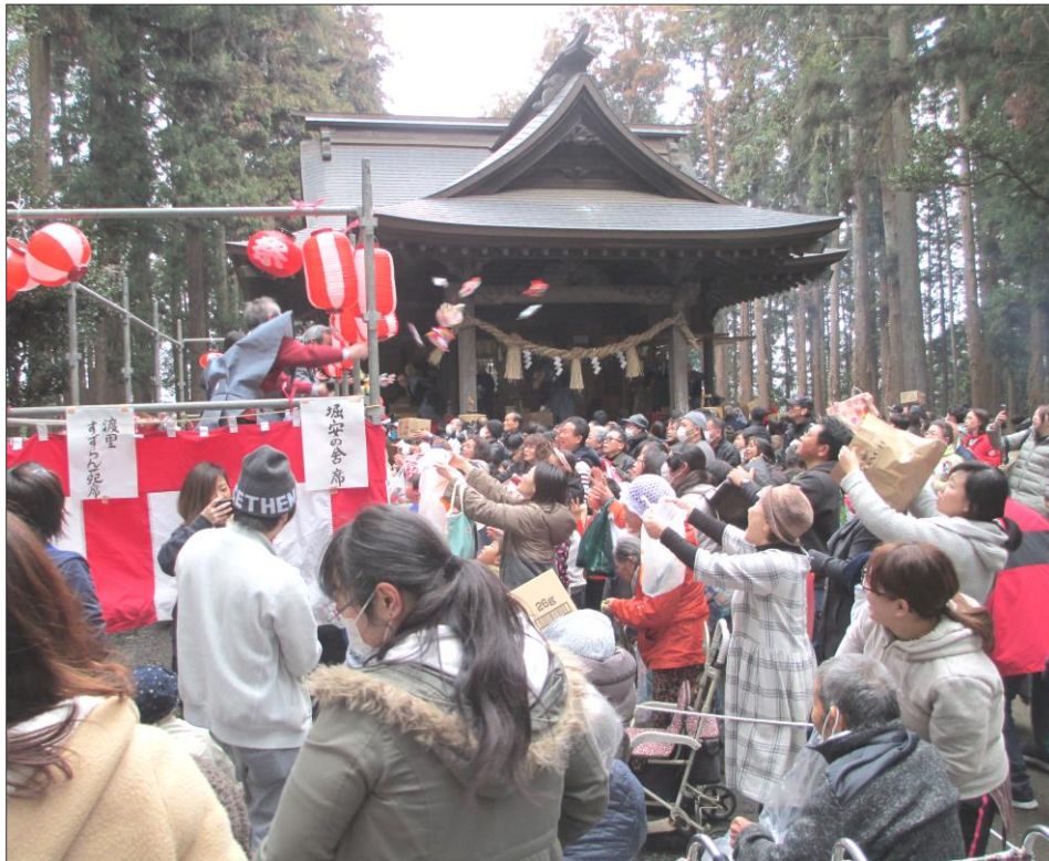
毎年大勢の参拜者で賑わう、吉田神社の厄除け祈願。

春を迎える風物詩：吉田神社の節分祭！ 「節分の高張立ちぬ大鳥居」（原石鼎） 鎮守の森といえ、真夏に蝉時雨を聞きながら参詣するのも爽快だが、また一方、真冬の厳寒と静寂に包まれた境内も身が引き締まり、その魅力は甲乙付け難いものがあります。 さて、すずらん苑では二月三日にご近所の吉田神社の節分祭に参詣して来ました。今年は日曜日になり子供達の姿も多く大変な賑わいでした。境内では懐かしい焚火がたかれており、また温かな甘酒の振る舞いもありました。甘酒をいただきながらしばらく待つと拝殿内で祝詞があげられた後、袴姿の氏子の