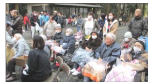
すずらん苑参加者の皆様