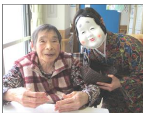
鬼が退散後、お福が福豆のプレゼント。