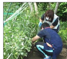
そら豆が見事に成長