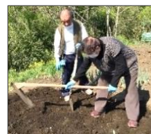
種まき前にうね作り

すずらん菜園での「野菜作り」や、そこで実った野菜を使つての「おやつ作り」も人気です。皆さんで育てそして収穫した食材によるおやつはおいしさも一味違います。