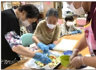
野菜をたっぷりのせました。

作つて楽しい食べておいしい「手作りおやつ」は、レクリエーションの定番です。今回はピザ作り。赤・黄・緑…彩り鮮やかに焼き上げました。 (デイ 十月十一日)