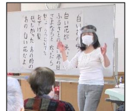
体にリズムを…「音楽療法」

「唱歌クラブ」では四季折々の歌を特集し、作詞者が謳いあげた季節感や自然観を楽しみます。また回想法を取り入れた「懐メロ倶楽部」や、心が安らぐ「カラオケ倶楽部」等バラエティー豊かに開催いたしております。