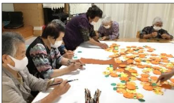
季節ごとにみんなで大作を共同制作