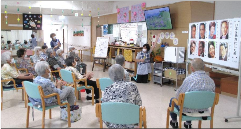
日本を元気にした歌をテーマに…「懐メロ倶楽部」

https://www.watarisuzuranen.jp/ 編集者 石井 利明