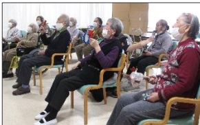
鳴子や太鼓を手にもって