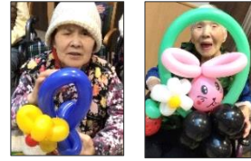
あつという間に次々と