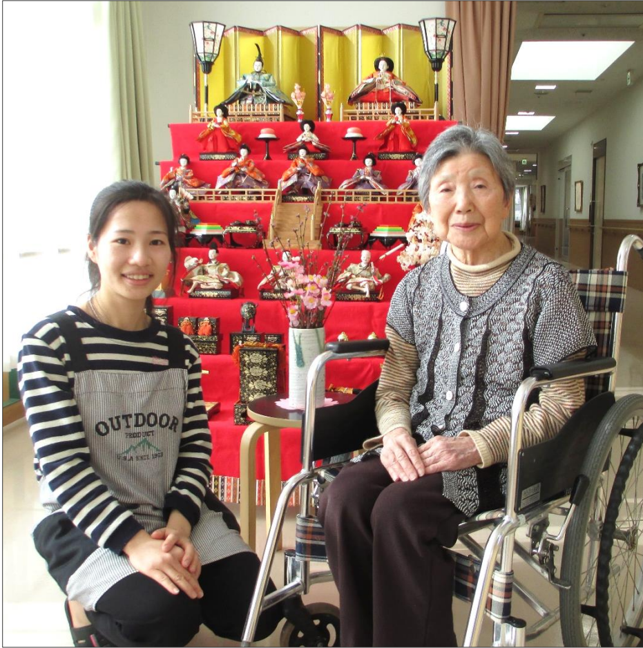
♪ あかりをつけましょ ぼんぼりに お花をあげましょ 桃の花 ~

https://www.watarisuzuranen.jp/ 編集者 石井 利明