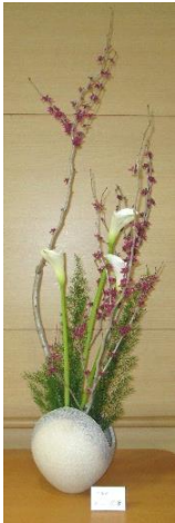
作品ご提供 龍生派 鈴木輝芳 先生