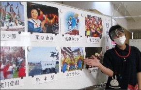
花笠音頭から九州炭坑節まで

北海道から沖縄まで、日本には地域の風俗を題材にした素晴らしい民謡がたくさんあります。今回は、ノリが良く元気の出る歌を中心に歌いました。(三月十五日)