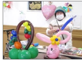
リクエストの作品も…